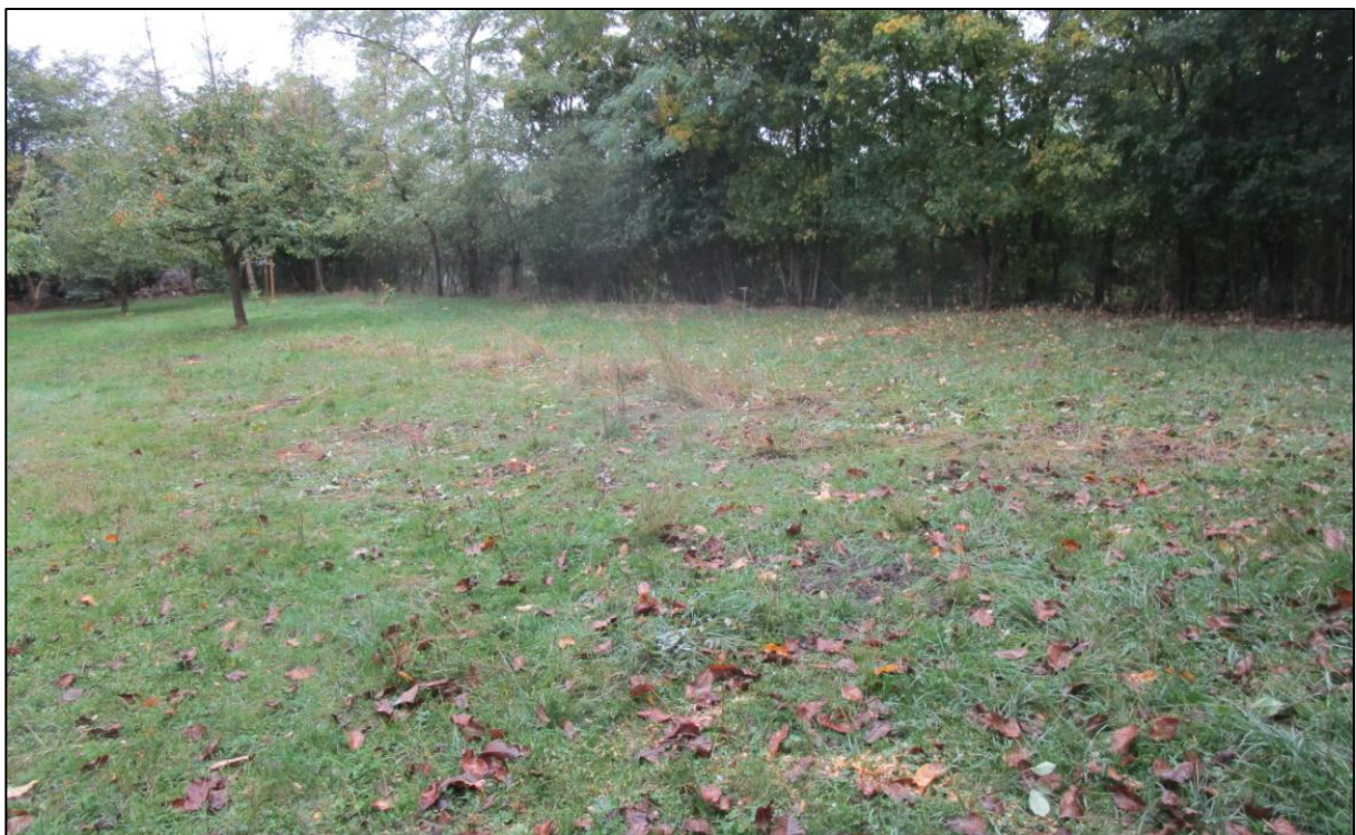
Fläche noch unbepflanzt