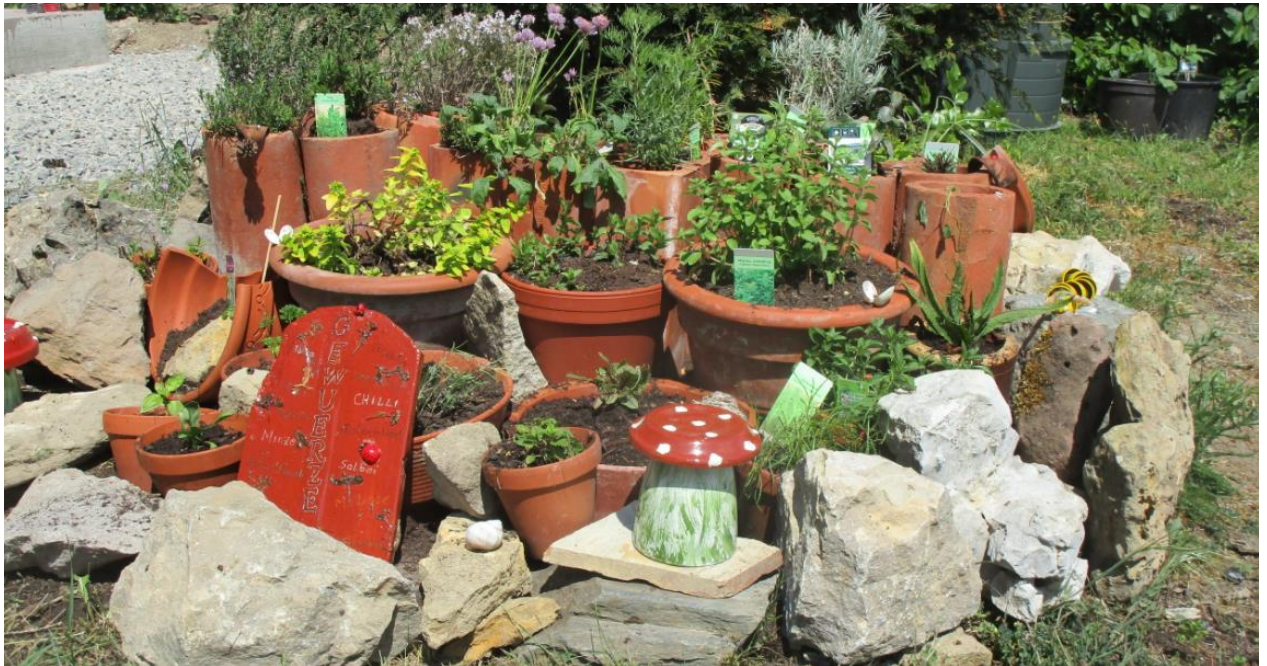
Der Kräutergarten sieht schon recht bunt aus