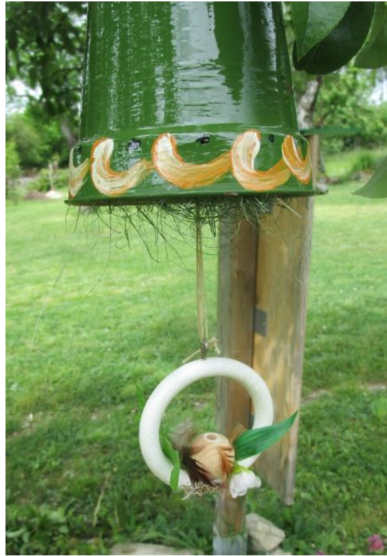
Schneckenhäuser und Designvögel verschönern den Garten