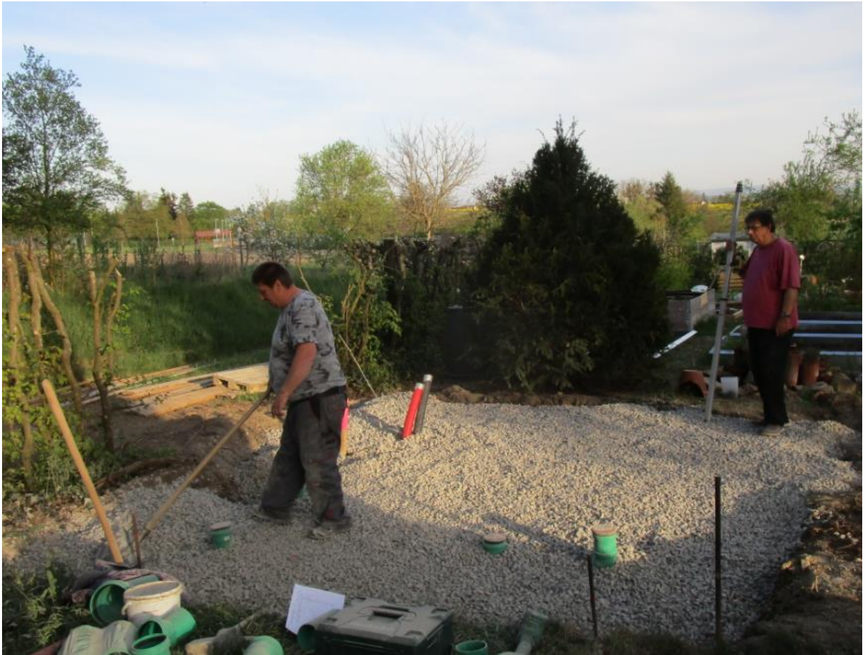
Mit dem Laser wird die Nivelierung überprüft