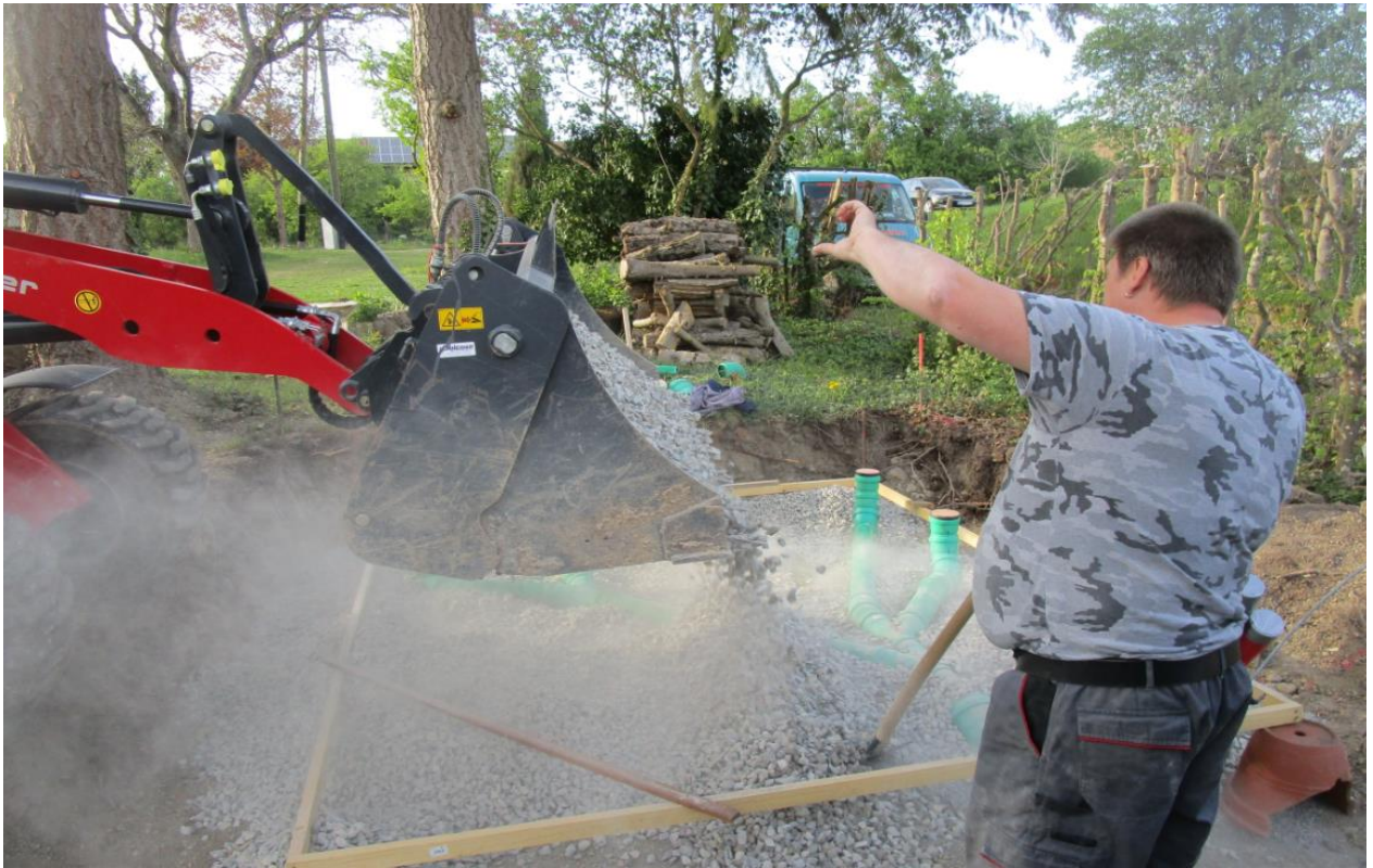
Grundlage wird verfüllt