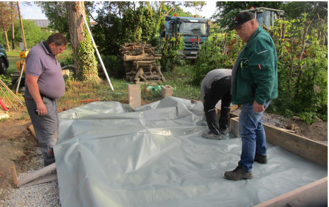
Grundierungsfolie wird eingelegt