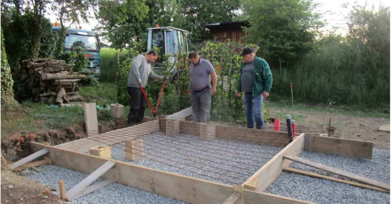
Armierungseisen werden zugeschnitten