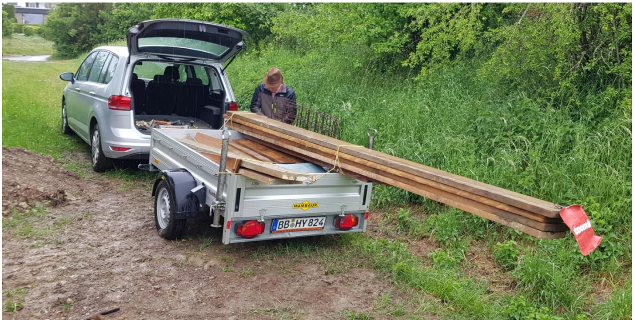
Schalungsmaterial geht zurück zur Fa.Roth