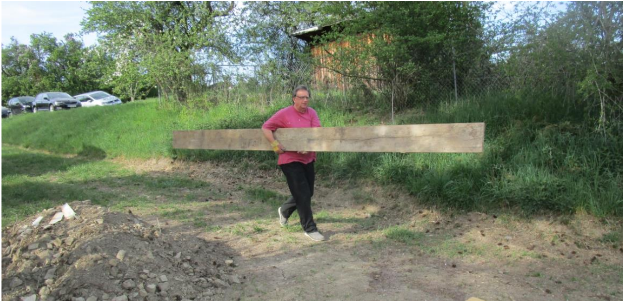
Das Schalungsmaterial wird angeliefert.