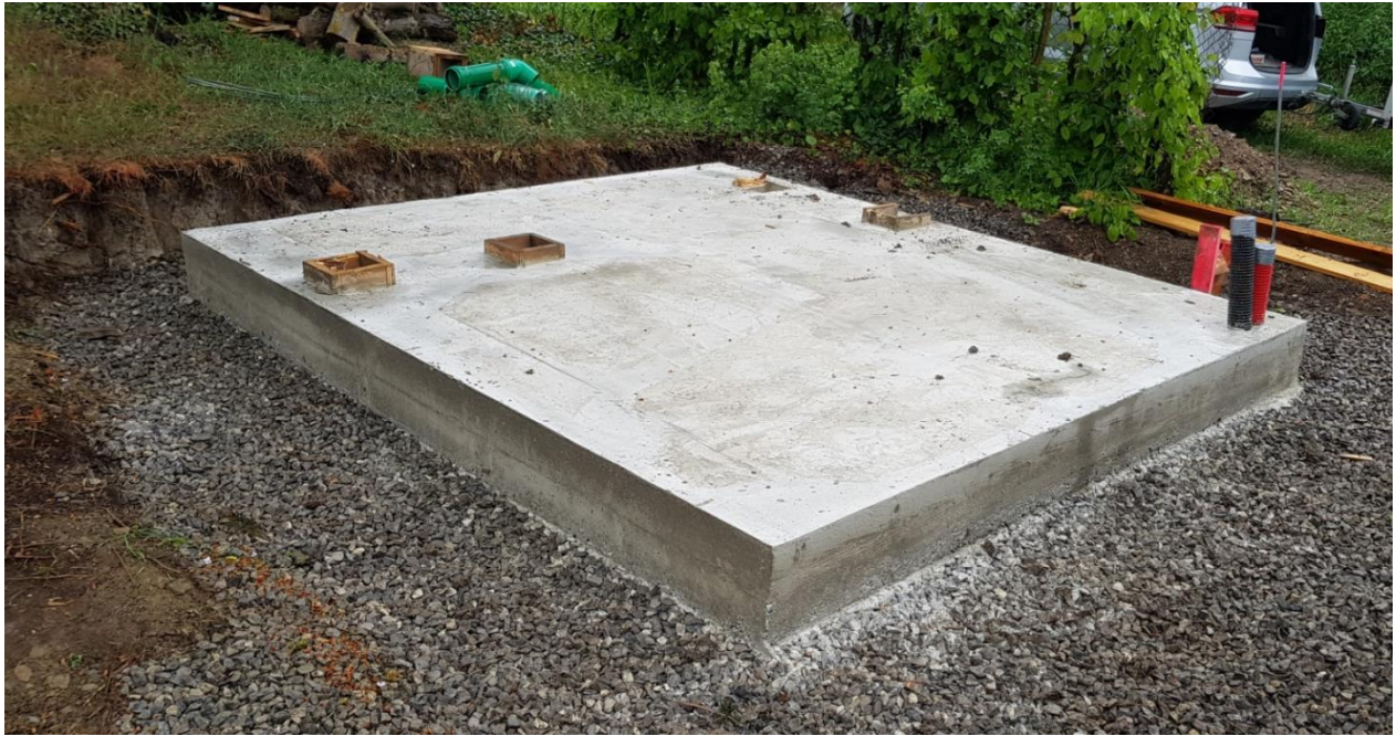
Schaut ganz ordentlich aus