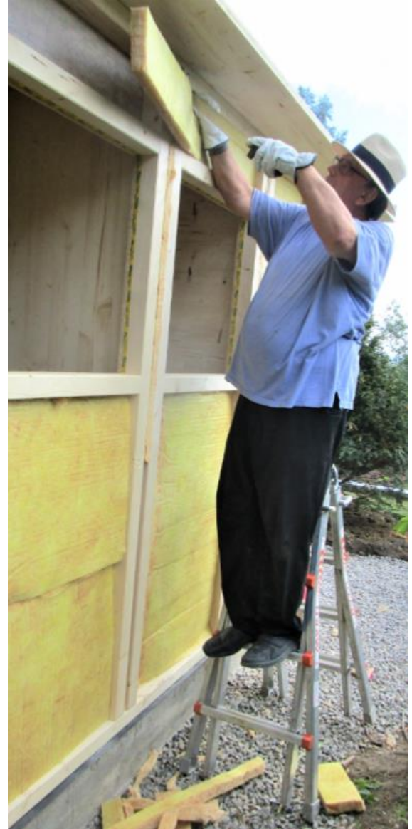
Die Isolierung erhält eine Folienabdeckung