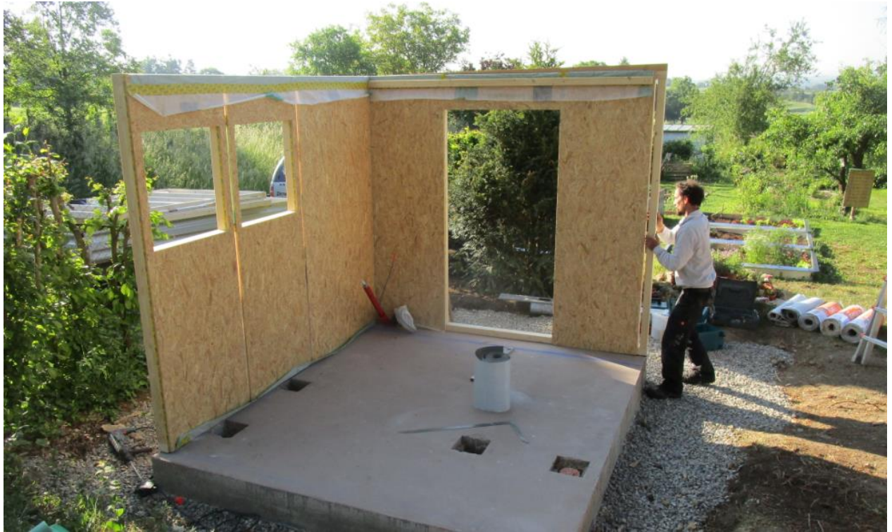
Die Wandelemente werden aufgestellt