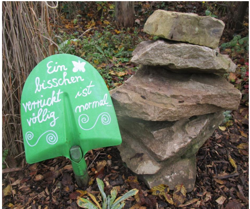
Gartenimpressionen der besonderen Art