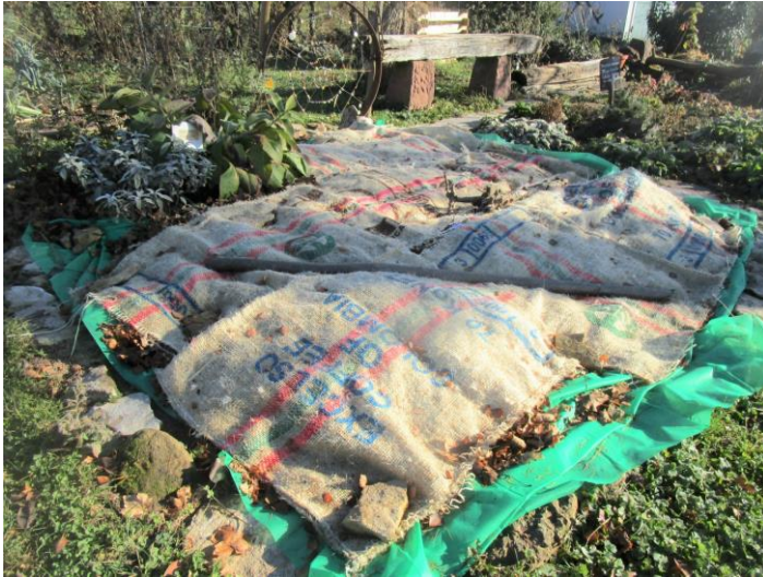
Stauden- und Gemüsebeete wurden „winterfest“ hergerichtet.