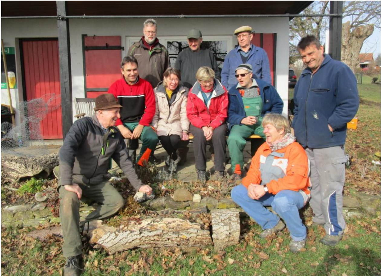
(Yogen Weinreich fehlt auf dem Bild, musste früher weg)

Es hat alles wunderbar geklappt, eine super Teamarbeit und die Stimmung war gut.